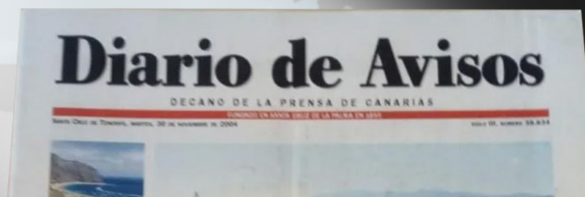
Diario de Avisos